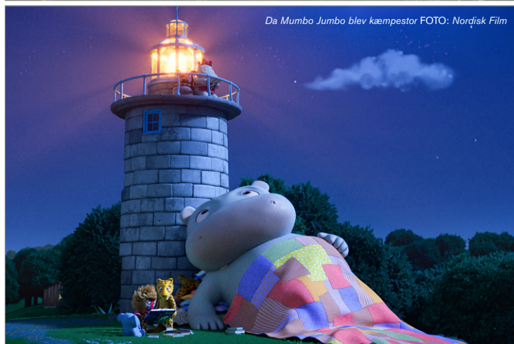
Da Mumbo Jumbo blev kæmpestor