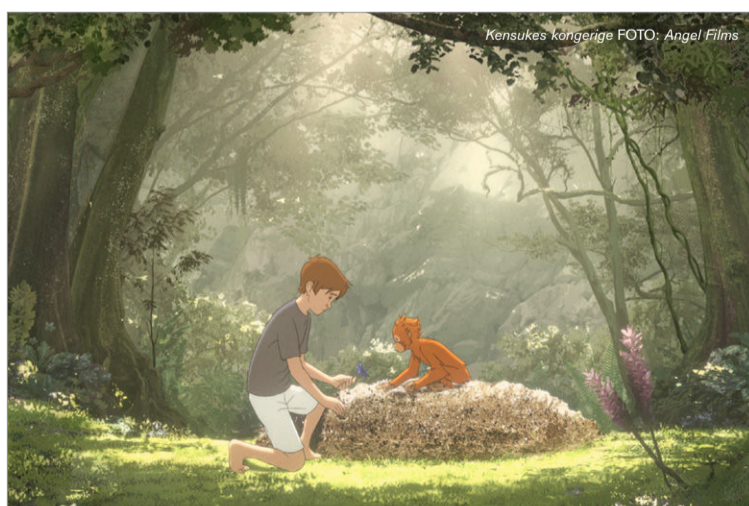
Kensukes kongerige