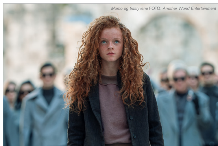
Momo og tidstyvene

FILM Entropy (Grønland, 2024), Tyven (Grønland, 2025), Piniartoq (Danmark, Grønland, 2019) Ivalu (Danmark, 2023), Sikoqqinnisaannassooq (Grønland, Norge, 2024) LÆNGDE ca. 75 min. VERSION Dansk og engelsk tekst DISTRIBUTION OFF UNDERVISNINGSMATERIALE filmfestival.dk / filmcentralen.dk/msib INGEN MEDIERÅDSVURDERING