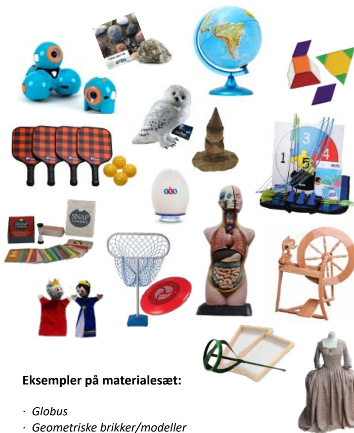
Eksempler på materialesæt:

Log på mitCFU, og søg det ønskede materialesæt. Book materialesættet ved at klikke på den røde knap.